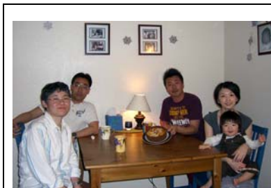
in my home 02-09-2008