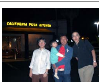
in CPK 05-10-2008