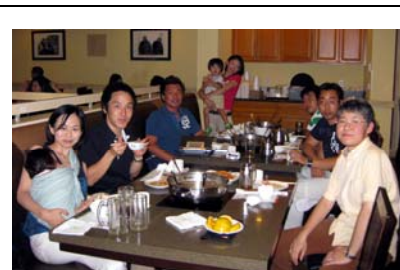
in 小肥羊 07-18-2008

このアパート Mirada には同じラボの日本人(注:1 人日本語が上手な韓国人)がたくさん住んでいます。こっちは日本みたいに飲み会という習慣もないので Mirada 会と称して何度か宴会しました。楽しい思い出です。