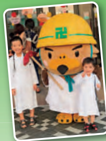
弘前市マスコットキャラクター たか丸くん