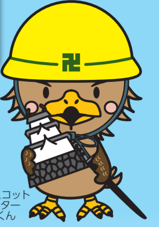
弘前市マスコット キャラクター たか丸くん